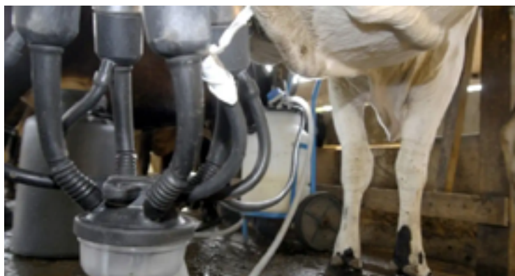
Produtores querem renegociação de débitos e medidas compensatórias ou tarifárias

A Confederação da Agricultura e Pecuária do Brasil (CNA) e outras entidades do setor leiteiro foram a Brasília em busca de soluções para a crise que afeta a produção em todo o país