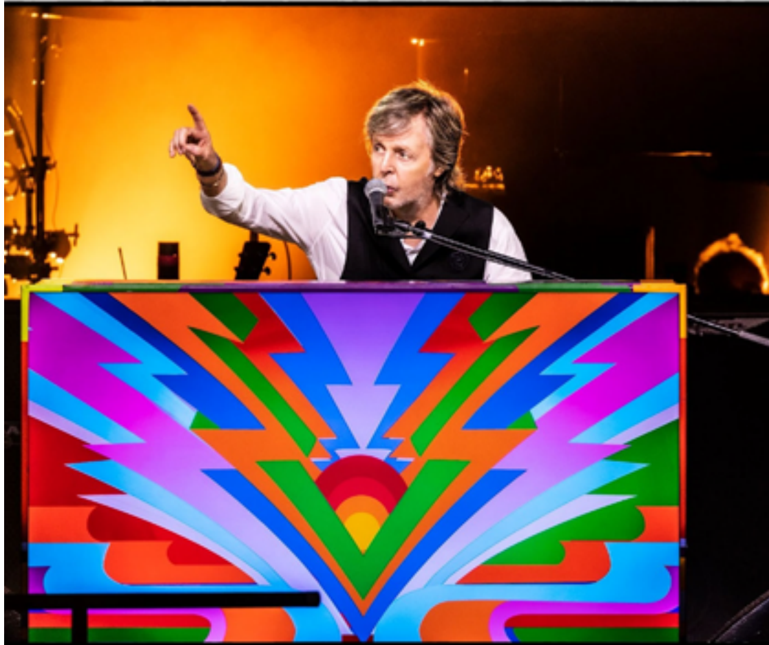
Banda na estrada: músico estrutura concerto em torno de hits, mas pode surpreender

Não, não é delírio da minha cabeça! Hendrix enviou ao beate um telegrama no qual dizia estar no estúdio acompanhado por Davis. "Que tal entrar