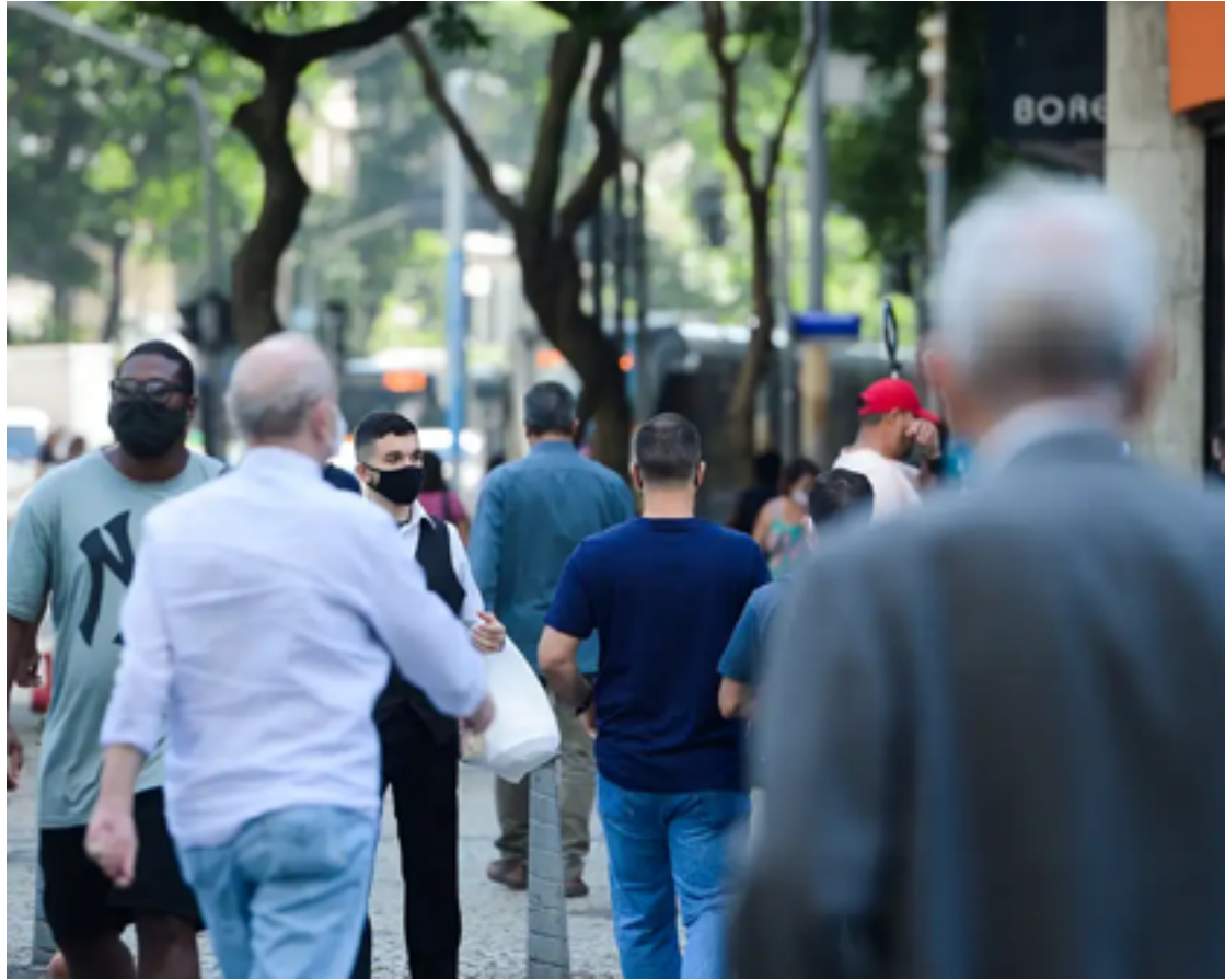
Em 2022, índice chegou a 75,5 anos, ainda abaixo de 2019, 2018 e 2017

Segundo dados divulgados nesta quarta-feira pelo IBGE, a expectativa de vida em 2022, ficou em 75,5 anos