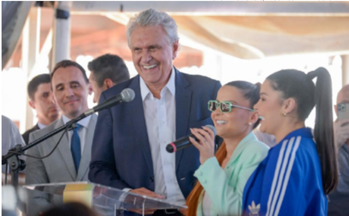
Ao lado de Ronaldo Caiado, Maiara e Maraísa elogiam Cora: “Obra está linda, perfeita! Goiás precisa desse apoio para ajudar as famílias”

O novo hospital em Goiás será o primeiro do estado voltado exclusivamente para o combate ao câncer. Inspirado no Hospital do Amor de Barretos (SP), o estabelecimento contará com 148 leitos para pacientes, um centro cirúrgico, farmácia, área de exames e, de forma inovadora, acomoda-