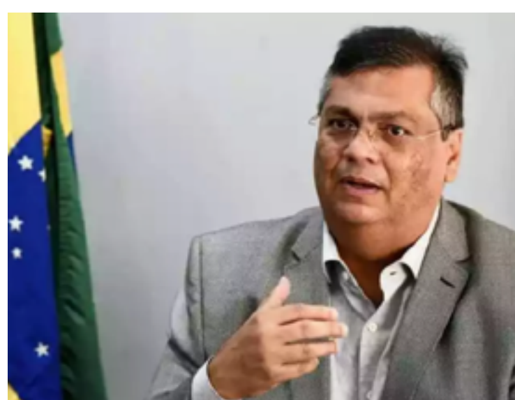
Flávio Dino: busca de votos dos senadores para vaga de ministro do STF

Dino evitou as comparações feitas pelo núcleo bolsonarista entre ele e o ministro Cristiano Zanin Martins, indicado por Lula para a penúltima vaga aberta no STF. O ex-governador do Maranhão afirmou que cada um tem suas características e que o importante é seguir a Constituição.