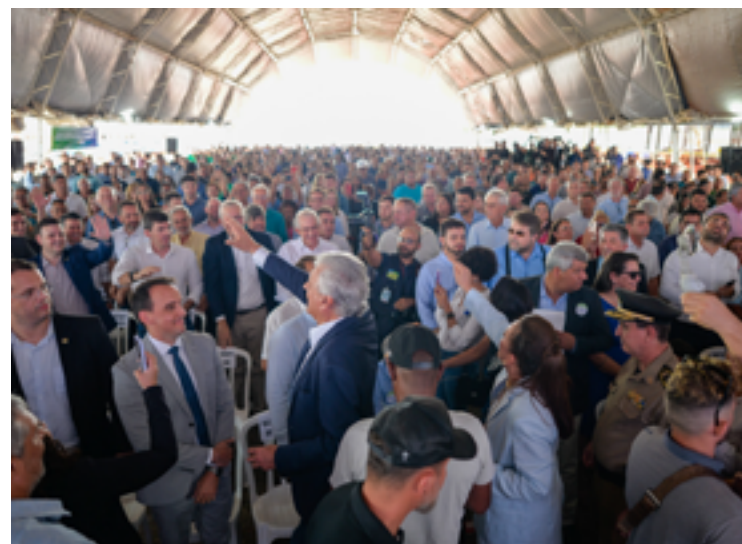
Governo, entidades e artistas se mobilizaram ontem em favor do Cora: encontro nacional pelo hospital

“Quero, ao terminar nosso mandato, poder dizer de cabeça erguida: consegui construir um hospital, uma policlínica, um hospital especializado no tratamento do câncer, essa é a marca que quero deixar: governador que salva e cuida de vidas”.