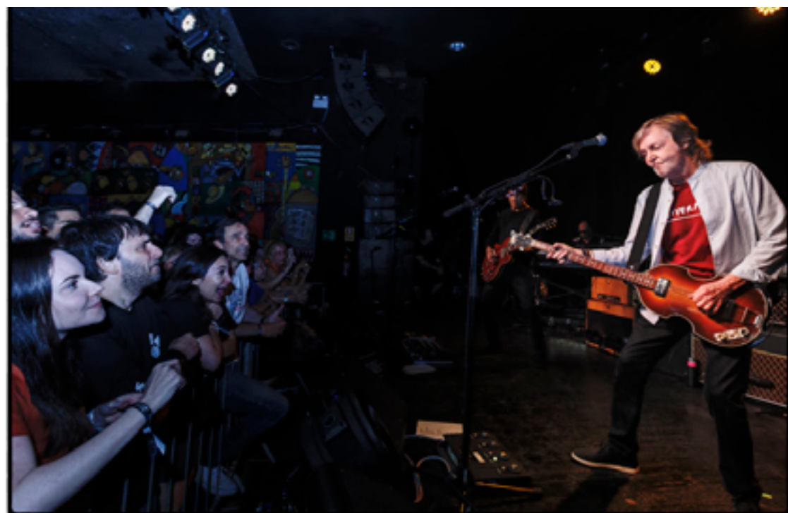
Clube do Choro: Paul proporcionou show intimista a fãs com clássicos de sua carreira solo e dos Beatles