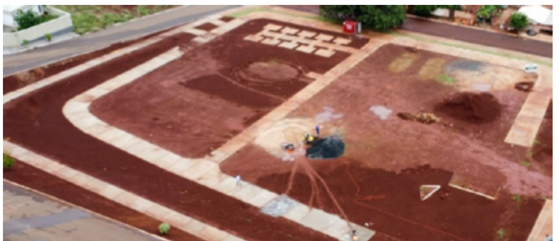
Vista aérea da construção de praça no setor Santo Antônio, em Jataí. Local oferecerá espaços de convivência e lazer adequado para os moradores — Foto: Reprodução.

A previsão para a conclusão desse projeto é janeiro de 2024, e a empresa responsável pela execução dos serviços é a IMEX Construtora LTDA.