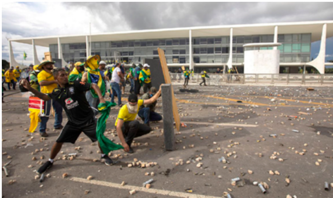
STF acelera investigação e julgamento dos acusados por atos de vandalismo na Praça dos Três Poderes

Ministro Alexandre de Moraes, do STF, autorizou buscas em sede endereços na 21ª fase da Operação Lesa Pátria e expediu mandado de prisão preventiva