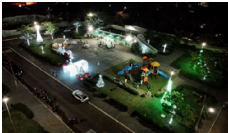
Campos Verdes: florida e iluminada